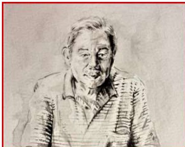
CECILIA PRETE, Ritratto di LUIGI BRUNI (acquerello su carta, dettaglio - 2017)