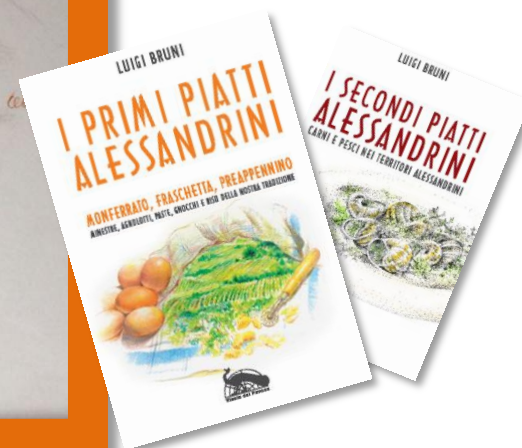
MONFERRATO FRASCHETTA PRAAPPENNINO