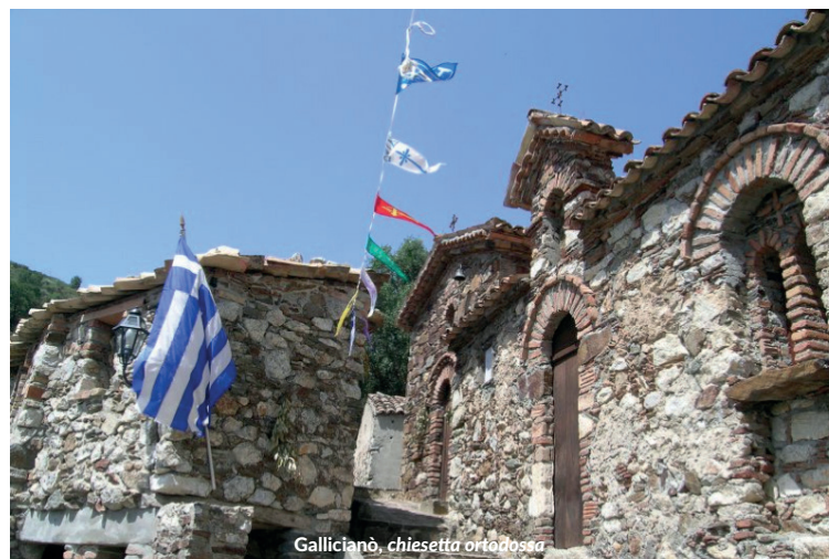
Galliciano, chiesetta ortodossa